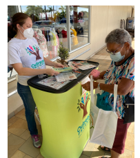
NeoMed, Naguabo, PR