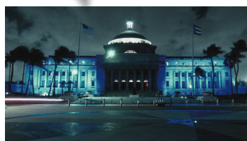
Capitolio de Puerto Rico