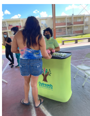
Health ProMed, Cataño, PR