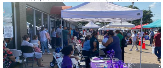
Health Fiesta, Pasadena, TX