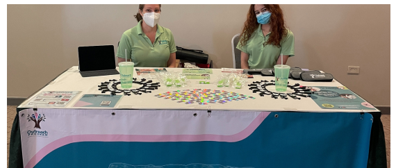
Retos y Oportunidades para la comunidad migrante, San Juan, PR