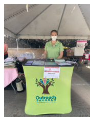
Salud Pa' la Calle, Juncos, PR

En Puerto Rico, hemos desarrollado alianzas con los centros de salud primaria (330), centros de vacunación y prácticas clínicas médicas. En Texas, nos hemos aliado con el programa de prevención y cernimiento 'Salud en mis Manos' y organizaciones comunitarias tales como Día de la Mujer Latina y ProSalud en el área de Houston y South Coastal Area Health Education Center en el condado de Nueces. Estas organizaciones se han unido a nuestra misión de educar sobre el VPH, los cánceres asociados y su prevención. En los pasados meses, hemos provisto a estas organizaciones, con diversos materiales educativos. Además hemos participado junto con ellos de una serie de actividades de alcance comunitario.