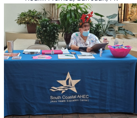
South Coastal AHEC Corpus Christi, TX