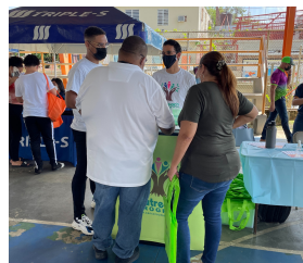
Health ProMed, San Juan, PR