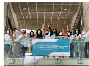
Centro Comprensivo de Cáncer